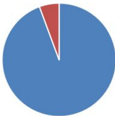
■ 基本支出（人员经费） ■ 基本支出（公用经费）

本年支出合计 85.90 万元，其中：基本支出 85.90 万元，占 100 %；项目支出 0 万元，占 0.0%；上缴上级支出 0 万元，占 0.0%；经营支出 0 万元，占 0.0 %；对附属单位补助支出 0 万元，占 0.0 %。基本支出中，人员经费 81.06 万元，占 94.4%；公用经费 4.84 万元，占 5.6 %。