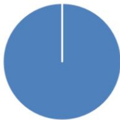
■ 财政拨款收入 ■ 其他收入